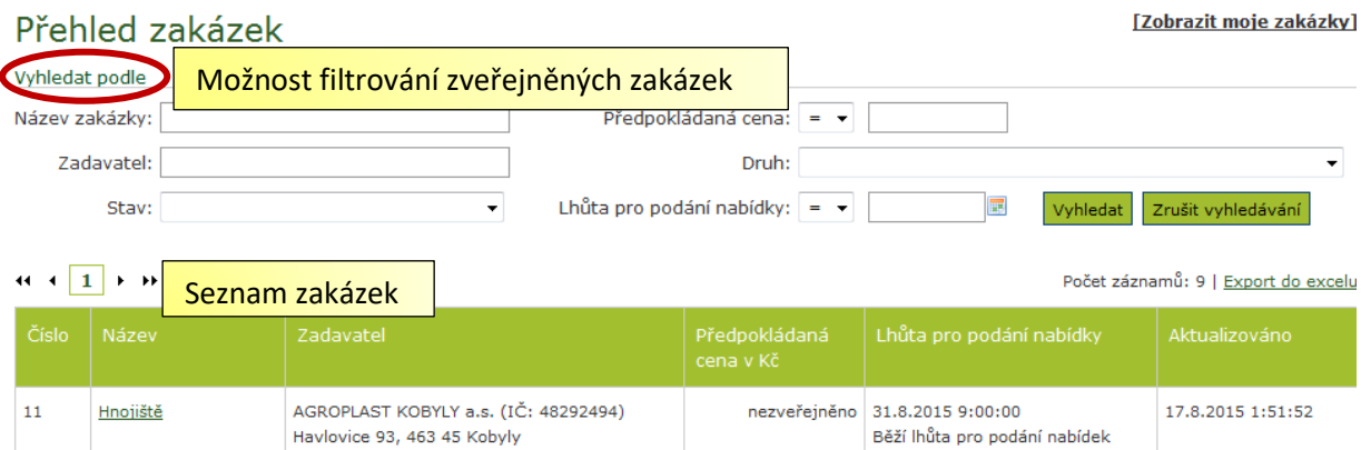
Obrázek 4 – Prohlížení zveřejněných zakázek

Zakázky je možné exportovat do XLS pomocí odkazu Export do Excelu.